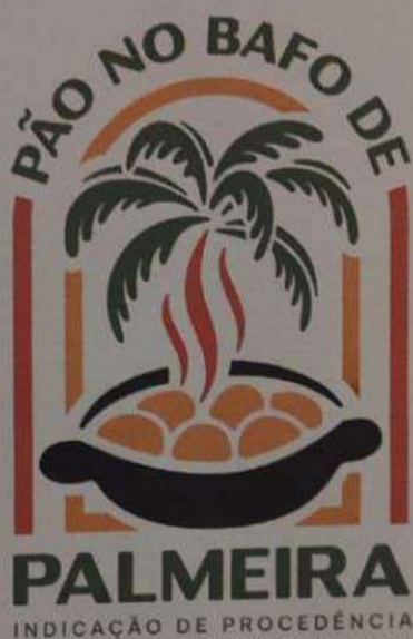
Figura 02 - Representação gráfica da IG a ser aplicada para os padrões de comercialização do Pão no Bafo.

A representação gráfica e figurativa da Indicação de Procedência "PALMEIRA" para o Pão no Bafo, com distintivo gráfico do tipo misto, de titularidade dos produtores estabelecidos no território delimitado e coordenada pelo Conselho Regulador da Associação dos Produtores de Pão no Bafo de Palmeira (APAFO) está assim definida: