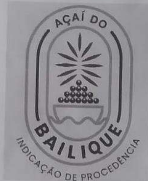
Figura 02 - Representação gráfica da IG a ser aplicada para os padrões de comercialização do açaí.

delimitado e coordenada pelo Conselho Regulador da Associação das Comunidades Tradicionais do Bailique está assim definida: