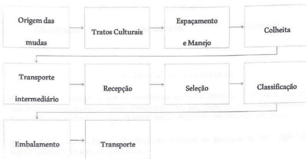
(a) Unidade de beneficiamento central