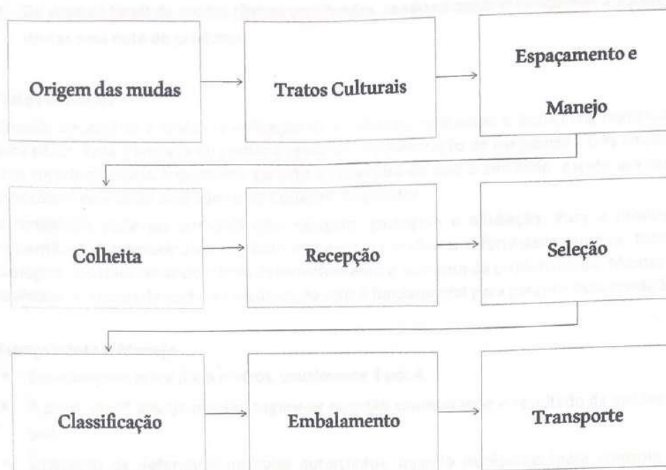
(b) Beneficiamento na propriedade.

Como apresentado na figura acima o beneficiamento da IP PONKAN DE CERRO AZUL pode ser realizado em unidade central (a) ou diretamente na propriedade (b). O que difere é a etapa transporte intermediário presente somente no beneficiamento em unidade central (a).