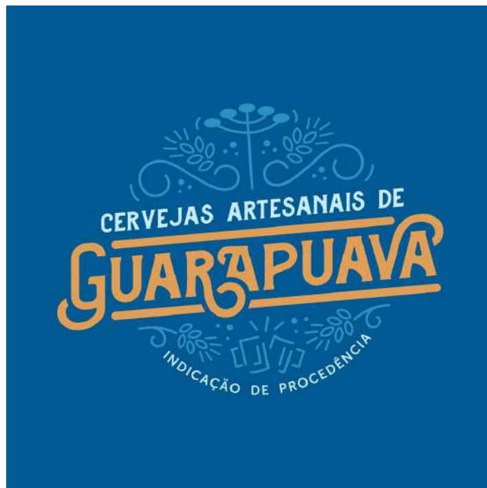
Figura 02 - Representação gráfica da IG a ser aplicada para os padrões de comercialização das Cervejas Artesanais.