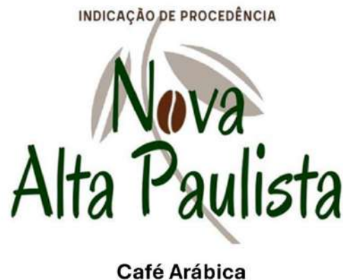
Figura 01. Sinal distintivo da Indicação de Procedência Café Arábica da Nova Alta Paulista.

II. O sinal distintivo (Figura 01) simboliza o produto café como fator crucial na formação do território da Nova Alta Paulista. O Café Arábica como produto que congrega a formação, a história e a cultura das cidades que compõem a Nova Alta Paulista. Um sinal sofisticado, onde o protagonista é o produto cultivado pelo cafeicultor – café, seu grão, suas folhas, suas cores acentuadas – marrom e verde. A Indicação de Procedência em letra tradicional, no tom marrom, Cafeeiro – somente caule e folhas, em tom cinza-claro, ao fundo. Já o nome da IP em verde, nos tons da folha do cafeeiro, o grão de café arábica ao meio, em tom marrom.