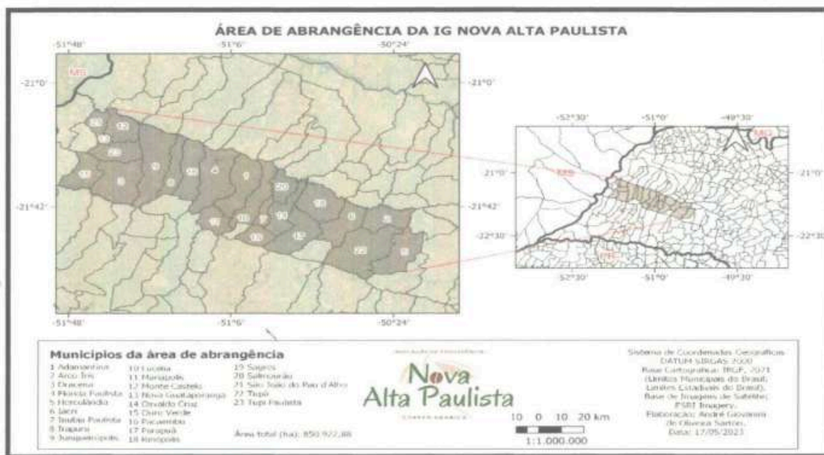
Mapa 01. Território da Indicação de Procedência Café Arábica da Nova Alta Paulista.

4.7. Nas páginas 178 e 179 do documento "Café Arábica da Nova Alta Paulista - Relatório do SEBRAE/IFSP (SEI nº 39112277) - Delimitação da área geográfica de produção da Indicação Geográfica, Junho 2023" citam: