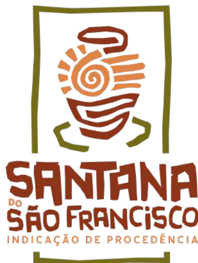
Figura 02 - Representação gráfica da IG a ser aplicada para os padrões de comercialização do Artesanato de Barro.

A representação gráfica e figurativa da Indicação de Procedência "SANTANA DO SÃO FRANCISCO" para o Artesanato de Barro, com distintivo gráfico do tipo misto, de titularidade dos artesãos estabelecidos no território delimitado e coordenada pelo Conselho Regulador da Associação dos Artesãos de Barro de Santana do São Francisco - ARBASSF está assim definida: